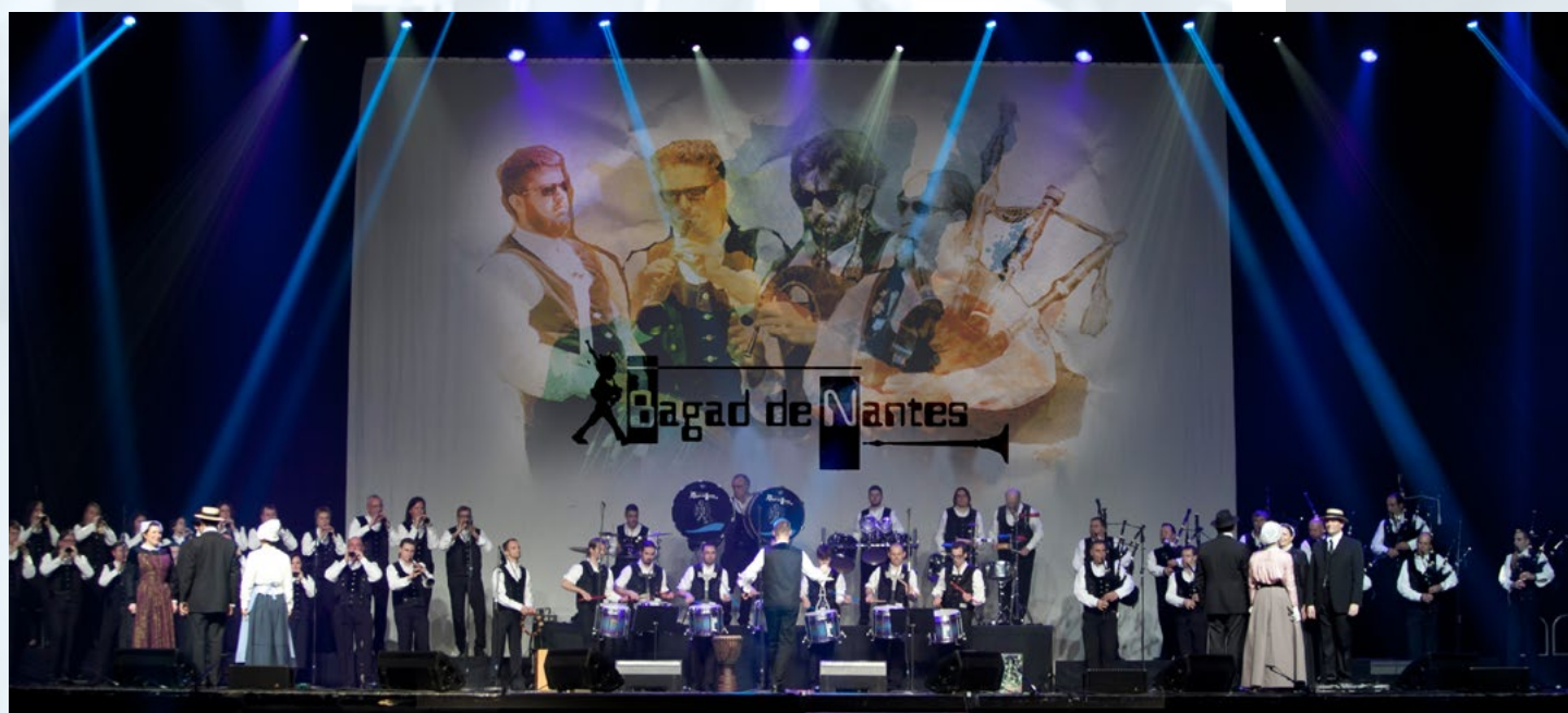
Concert de la saint Patrick au Zénith de Paris avec le cercle Olivier de Clisson.

Le Bagad de NANTES s'est aussi produit à l'étranger : Pays de Galles, Irlande, Ecosse, Luxembourg, Galice-Espagne, Belgique, Allemagne, etc.