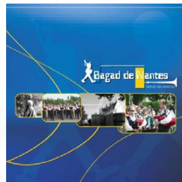
2001 « Skeud An Ankou »