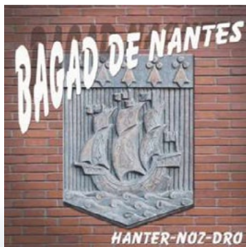
2001 « Hanter Noz Dro »