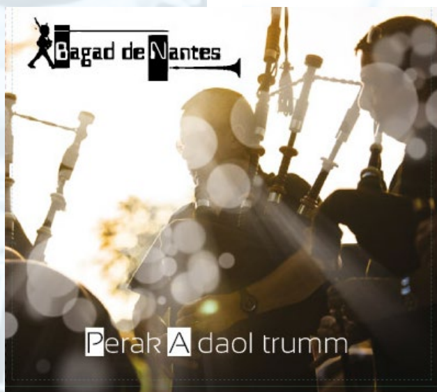
2016 « Perek a daol trumm »

Participation du Bagad de NANTES à divers productions de renom