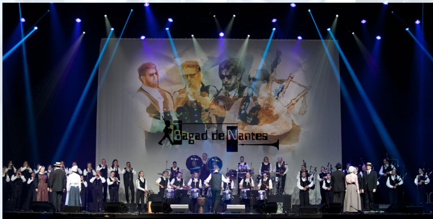
Concert de la saint Patrick au Zénith de Paris avec le cercle Olivier de Clisson.

Le Bagad de NANTES s'est aussi produit à l'étranger : Pays de Galles, Irlande, Ecosse, Luxembourg, Galice-Espagne, Belgique, Allemagne, etc.