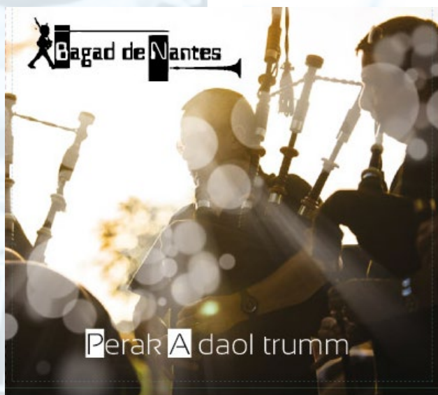
2016 « Perek a daol trumm »

Participation du Bagad de NANTES à divers productions de renom